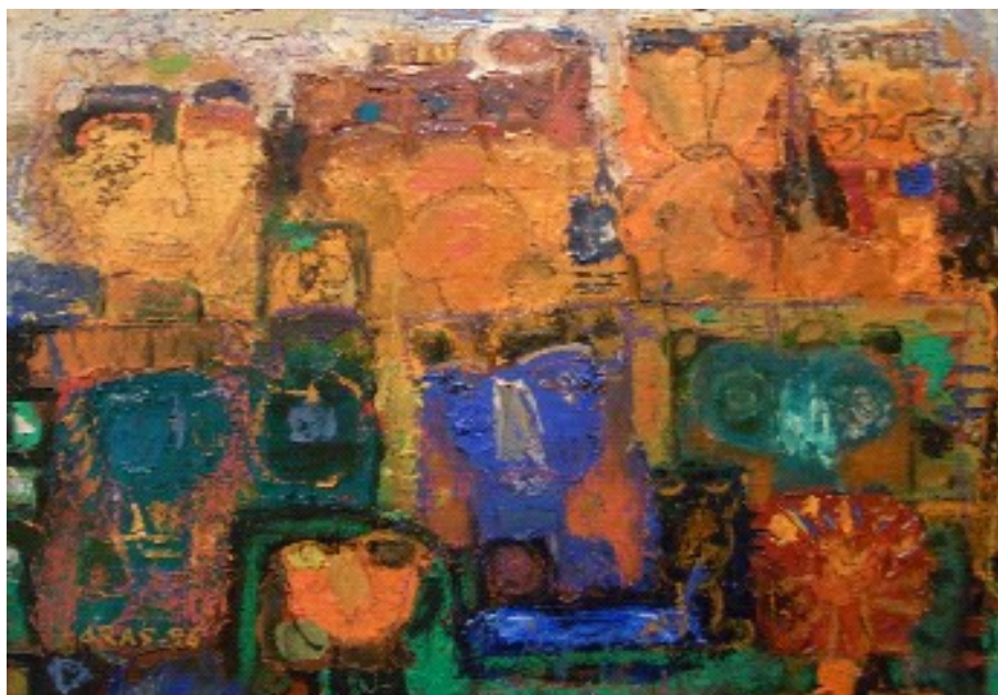
Afb.2 Onvergetelijke herinneringen, 1996, 60x70, olieverf op doek