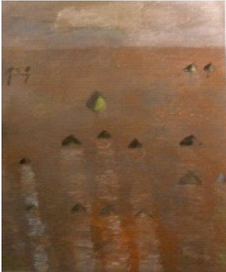
Storm, 2006, 70 x 90, olie op doek