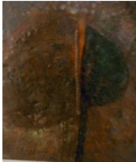
Omhelzing, 2010, 50 x 60, olie op paneel

Hoewel Aras bij het scheppingsproces zich laat leiden door zijn intuïtie, betekent dit niet dat hij dit als een vrijblijvendheid ziet. Het gaat hem erom zo precies mogelijk zijn gevoel over te brengen. 'Ik fantaseer niet in mijn werk' zegt Aras. Het is voor hem een gerichte zoektocht, telkens vanuit een andere hoek belicht, maar die altijd uitkomt op die ene vraag: wie ben ik? Waarbij het uiteindelijke resultaat geen antwoord blijkt te zijn maar weer nieuwe vragen oproept.