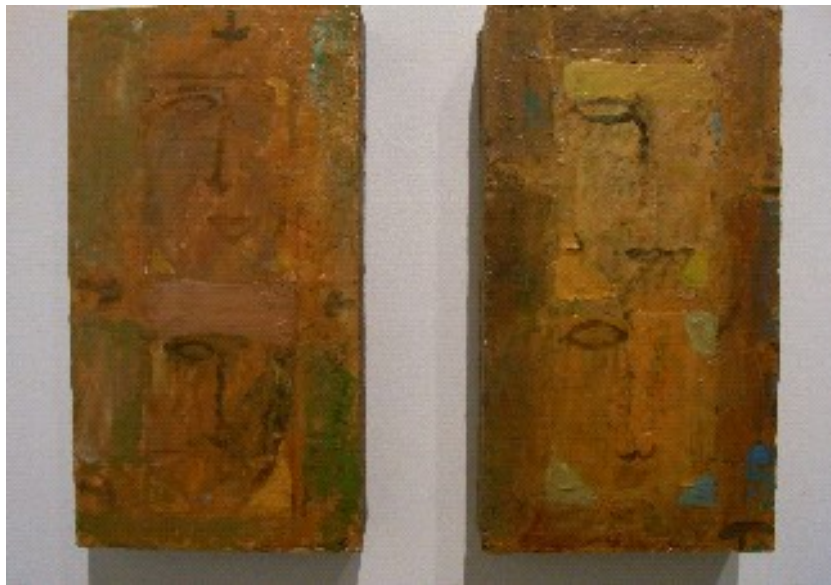
2x Gezichten, 2004, 22 x 52, acryl op paneel

Over zijn werkwijze vertelt Aras het volgende: 'Als ik voor een leeg doek of een wit vel papier sta, probeer ik contact te maken. Ik probeer hierbij niet te denken. Wanneer ik de eerste strek zet, laat ik me leiden door het onbewuste. Dan is er het begin gemaakt en gaat het proces vanzelf verder'. Het ontstaansproces van een werk vergelijkt hij met het maken van een wandeling. 'Je loopt naar buiten en gaat op ontdekkingsreis. Je laat je leiden door wat je tegenkomt. Het gevoel van wat je tegenkomt keert op de een of andere manier altijd terug in het werk. Het kan van alles zijn, van het gevoel van de wind tot het ritselen van de bladeren. Maar uiteindelijk bepaalt het werk zelf welke richting het opgaat. Voor mij is het proces interessanter dan het resultaat. Ieder nieuw werk betekent voor mij