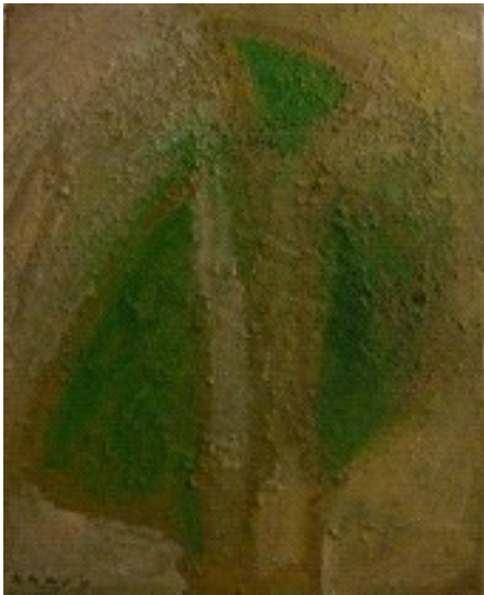
De boom, 2010, 40 x 50, olie op doek

een eerste stap. Het voorgaande moet eerst worden afgebouwd, niet verder worden uitgebouwd. Kunst is voor mij een uitdrukkingstaal, waarin ik weer telkens weer iets nieuws kan zeggen'.