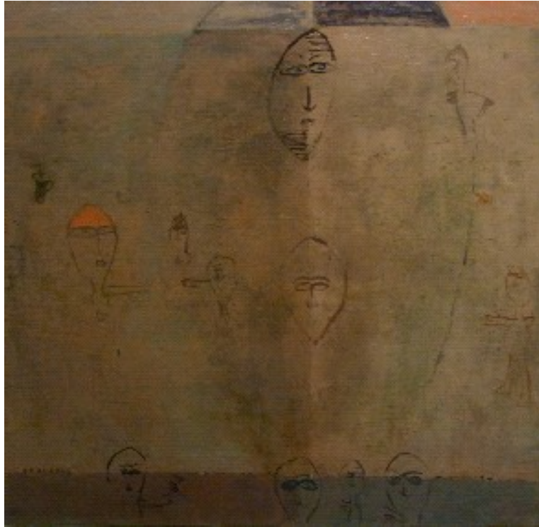
Stad van liefde, 2004, 80 x 80, olie op doek