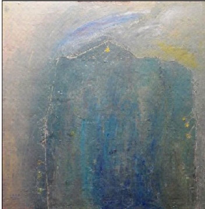
Afb. 1 Huis in gedachten, 2010, 80 x 80, olie op doek