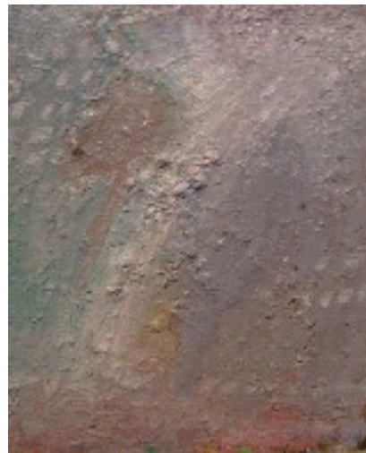
Blauwe avond, 2006, olie op doek